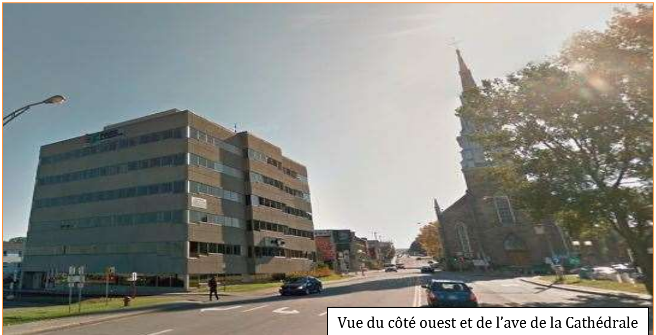
Vue du côté ouest et de l'ave de la Cathédrale