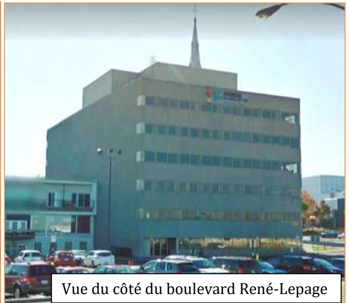
Vue du côté du boulevard René-Lepage