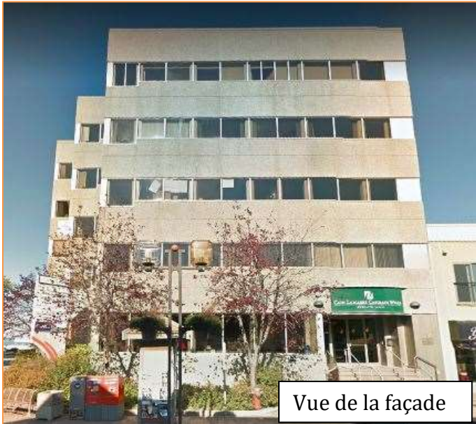
Vue de la façade